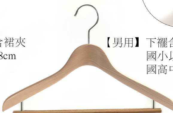
【男用】下襠含褲棍 國小以下長度38cm 國高中以上長度42cm