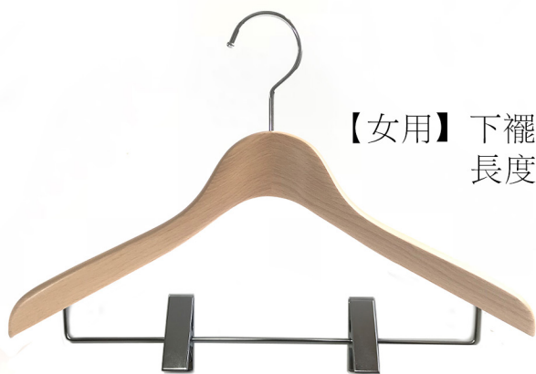
【女用】下襠含裙夾 長度38cm